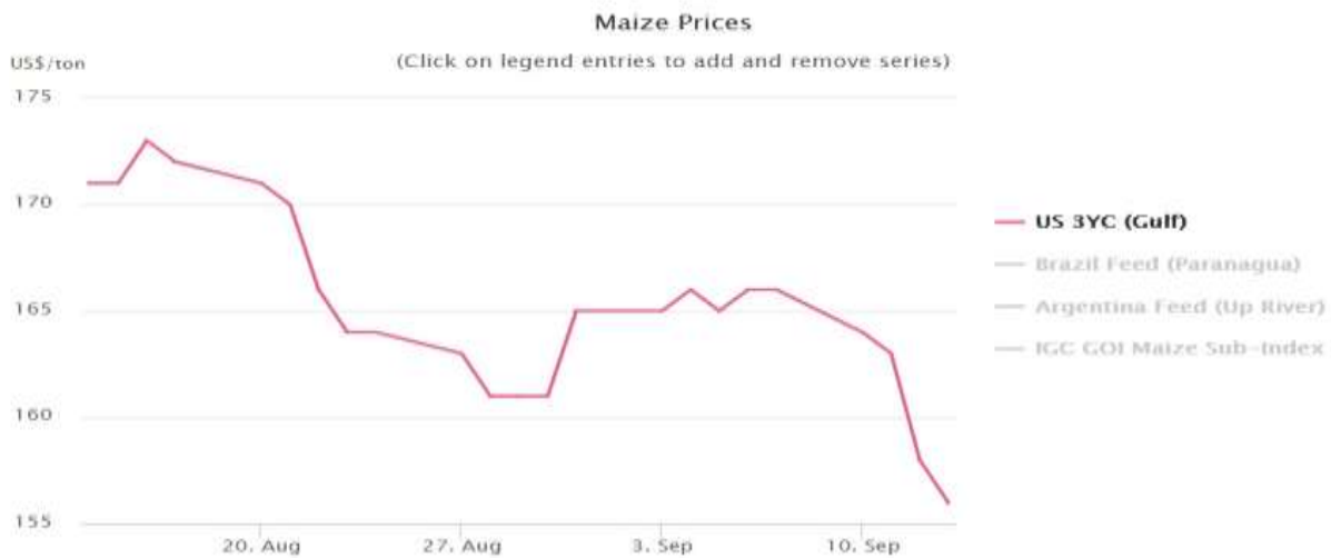
نمودار ۲- تغییرات قیمت جهانی ذرت آمریکا (دلار/تن)